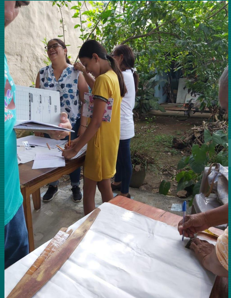
Curso de patrones de costura