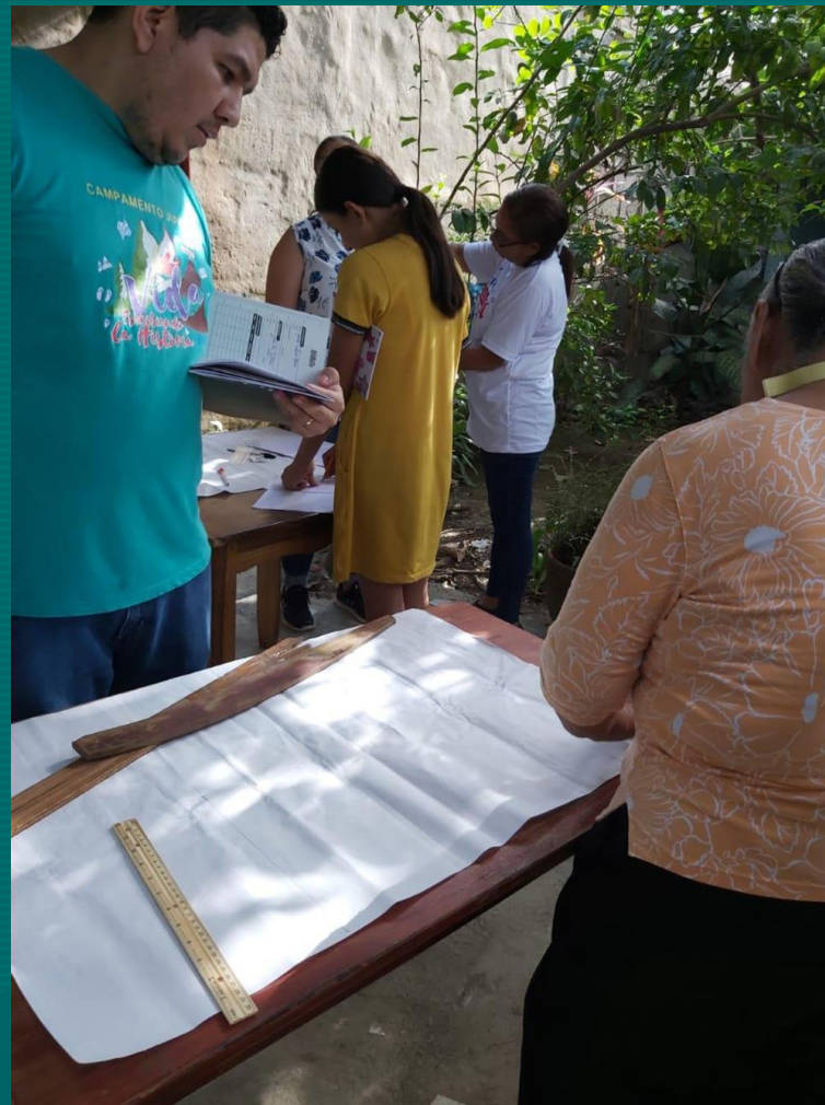
Curso de patrones de costura